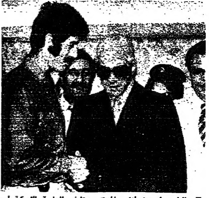
الرئيس شمعون لدى مغادرته مستشفى الجامعة الأمريكية أمس، ويبدو إلى اليمين طبيب الكونديتور عدنان حسانة

غادر الرئيس شمعون مستشفى الجامعة الأمريكية قبل ظهر أمس بعد أسبوع على عملية جراحية في عينه، التي نجح نالي. وتلقى بمطار الرئيس شمعون، أتسكيون مستعداً لاستقبال نشاطه السياسي خلال هذا الأسبوع.